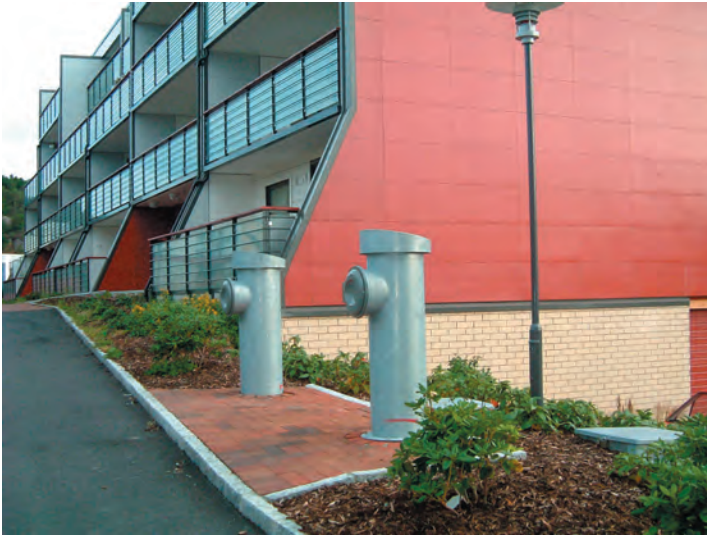
Vanlige nedkast med bossugsystem